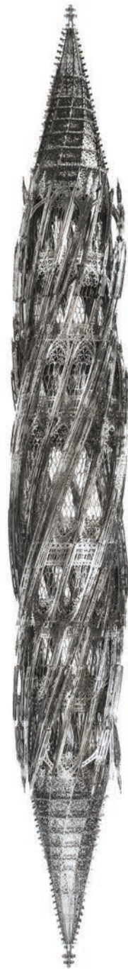
^ Suppo Penta (Clockwise), 2013, laser-cut stainless steel, 330 x 42 x 42 cm > Suppo, 2010, laser-cut stainless steel, 1100 x 129 x 130 cm Wim Delvoye au Louvre, 31.05.2012 – 17.09.2012, Musée du Louvre, Paris