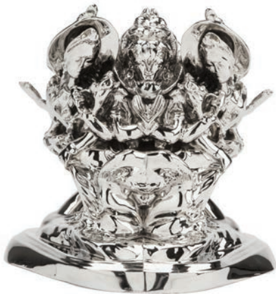
Rorschach Trinity , 2012 nickel-plated bronze, 33.5 x 32 x 30 cm