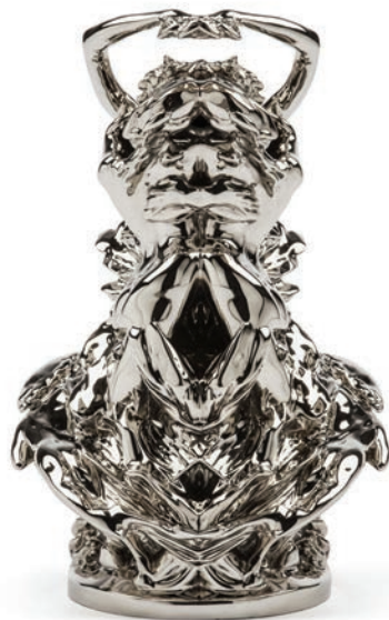
Le Secret Rorschach , 2012 nickel-plated bronze, 46 x 21 x 20 cm