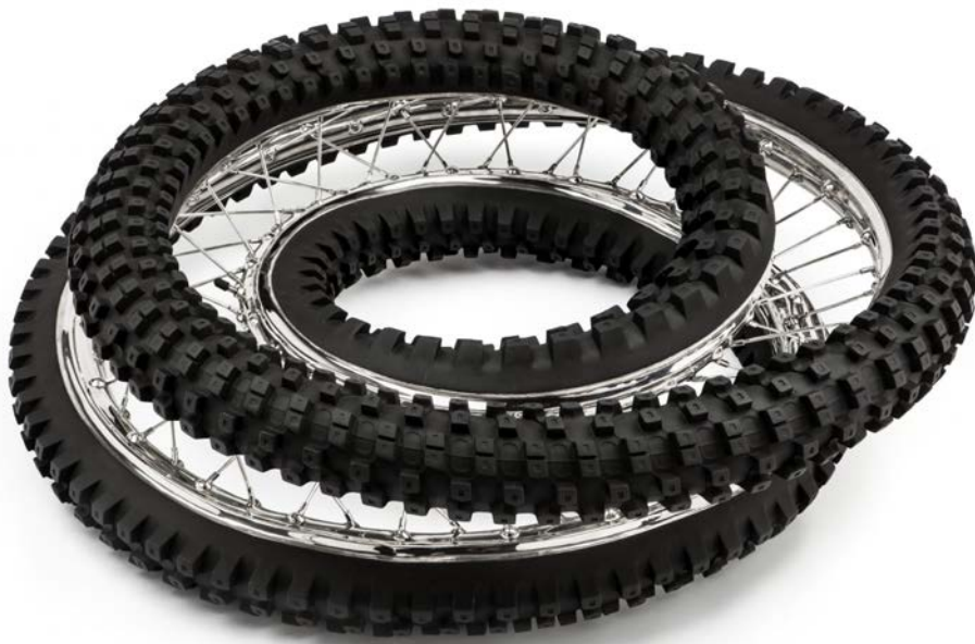
Wim Delvoye Dunlop Geomax 100/90-19 57M 120° 3X, 2013 Polished & patinated stainless steel 87 × 87 × 24 cm DELV0063