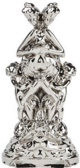
La Jeunesse Rorschach , 2013 nickel-plated bronze, 46.6 x 22.9 x 16.2 cm