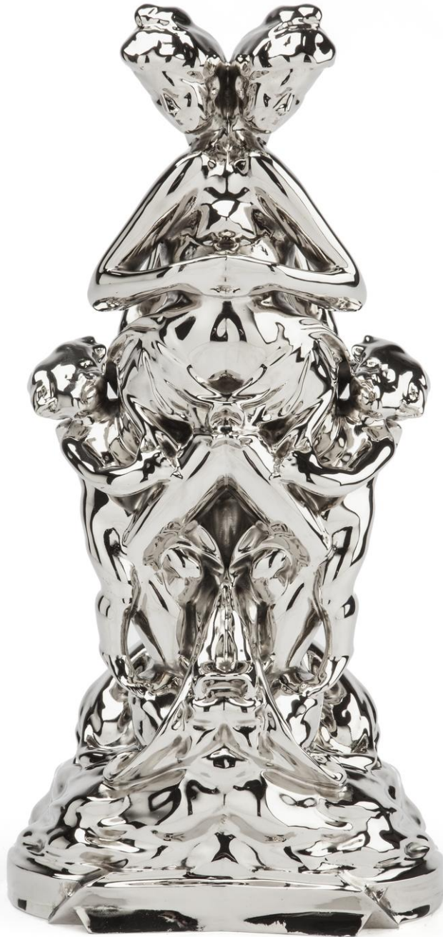
Wim Delvoye La Jeunesse Rorschach, 2012 Nicked bronze 23 × 16 × 46,5 cm DELV0061