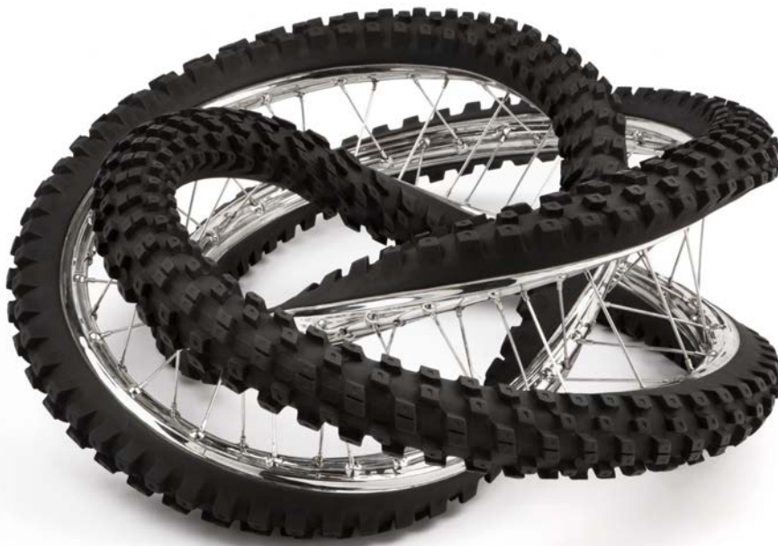
Wim Delvoye Dunlop Geomax 100/90-19 57M 360° 3X, 2013 Polished & patinated stainless steel 87 × 87 × 34 cm DELV0064