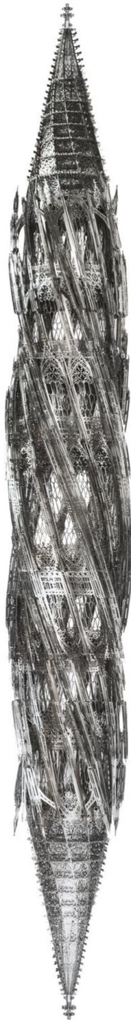
Wim Delvoye Suppo Penta (Counterclockwise), 2013 Laser-cut stainless steel 330 x Ø 42 cm DELV0058