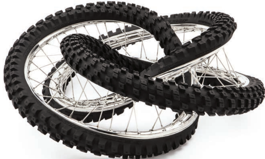
Dunlop Geomax 100/90-19 57 M 360° 3 X , 2012, polished and patinated stainless steel, 91.5 x 72 x 31 cm

ARNDT is pleased to present a solo show by the internationally renowned artist Wim Delvoye at Abu Dhabi Art 2014, where the gallery is exhibiting recent works from his coveted Gothic and Rorschach series, as well as new twisted-tire pieces that are perfectly fit for the desert terrain.