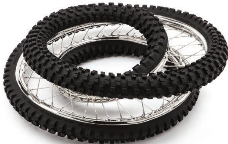
Dunlop Geomax 100/90-19 57 M 120° 3X , 2013 polished and patinated stainless steel, 87 x 87 x 27 cm