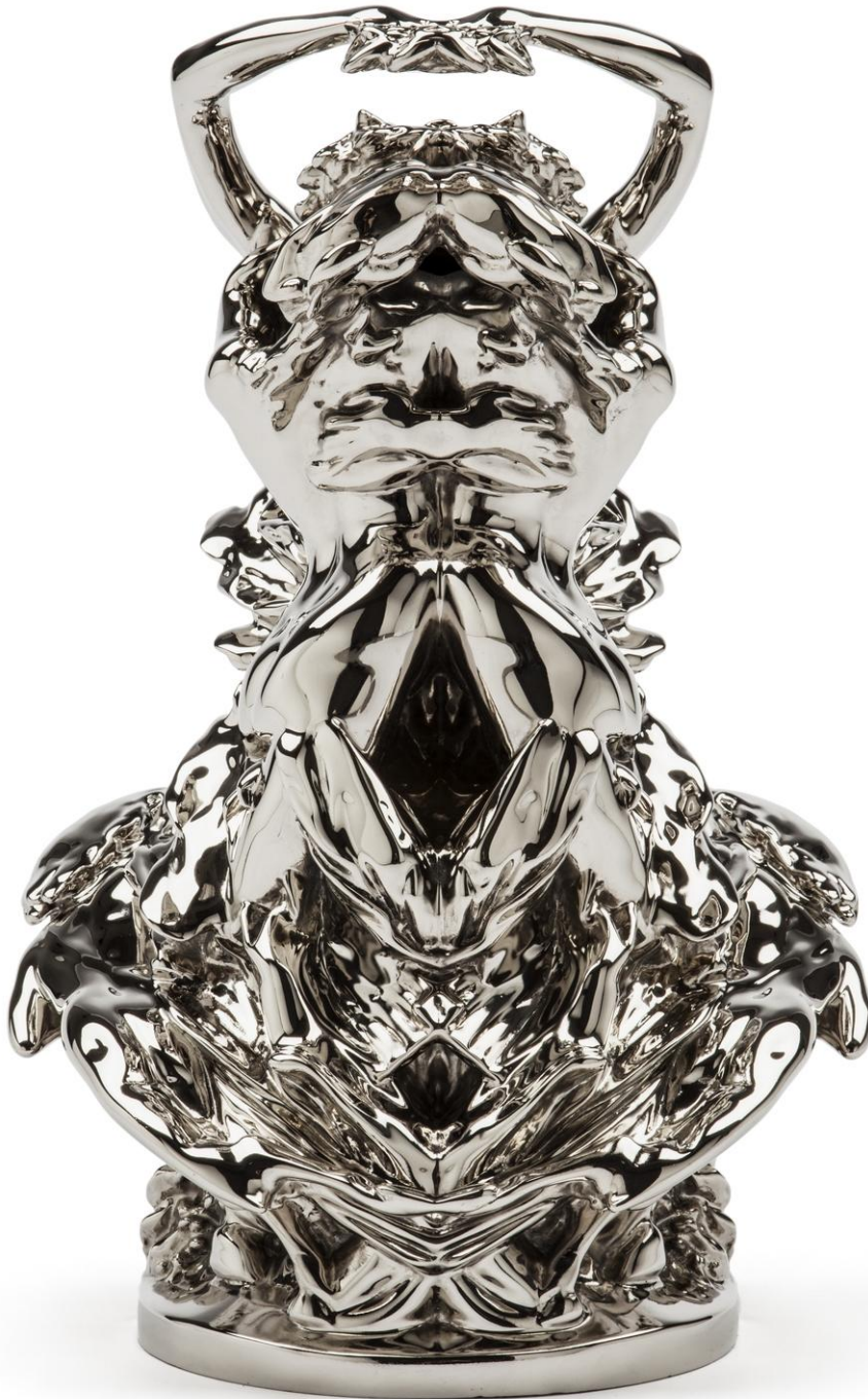
Wim Delvoye Le Secret Rorschach, 2012 Nickered bronze 27,5 × 27,5 × 40 cm DELV0062