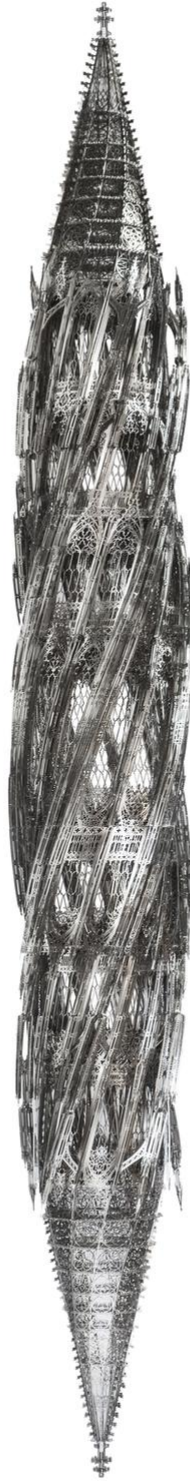
Wim Delvoye Suppo Penta (Clockwise), 2013 Laser-cut stainless steel 330 x Ø 42 cm DELV0057