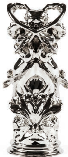
Daphnis & Chloë Rorschach III , 2012 nickel-plated bronze, 40 x 17.9 x 22.9 cm