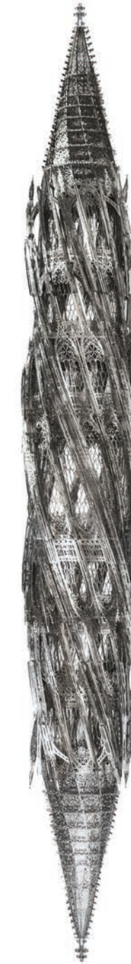
^ Suppo Penta (Counterclockwise), 2013, laser-cut stainless steel, 330 x 42 x 42 cm < Suppo, 2010, laser-cut stainless steel, 1100 x 129 x 130 cm Wim Delvoye, 01.03.2013 – 01.09.2013, San Cristoforo, Lucca