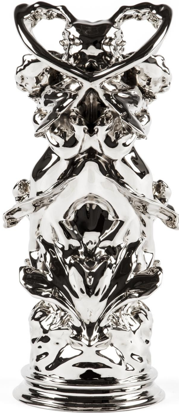
Wim Delvoye Daphnis & Chloë Rorschach III, 2012 Nickered bronze 18 × 23 × 40 cm DELV0059