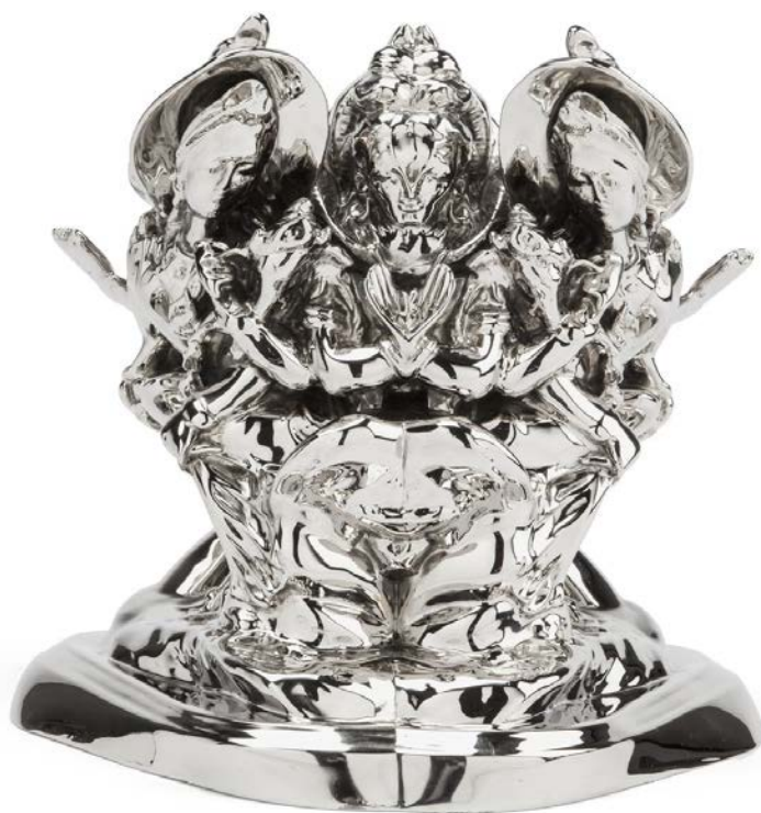
Wim Delvoye Trinity Rorschach, 2012 Nickered bronze 30 × 32 × 33,5 cm DELV0060